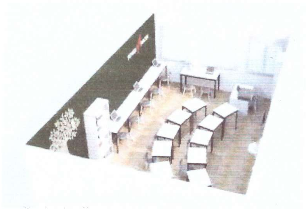
Коворкинг - зона (рекреационная зона).