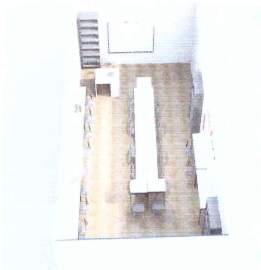
Кабинет биологии и химии.